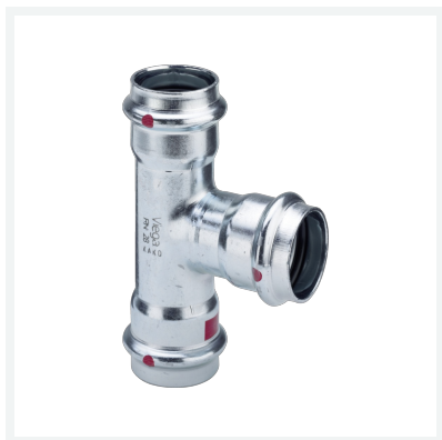
Té Prestabo avec SC-Contur modèle 1118 article 558 659