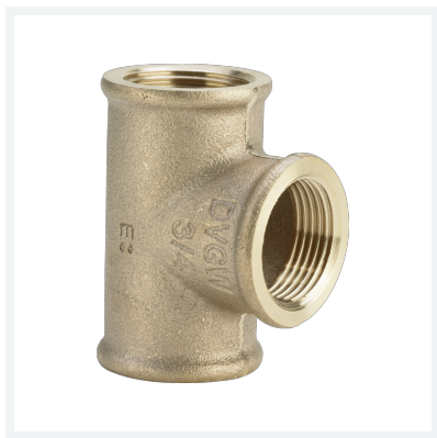
Té modèle 3130 article 264 246