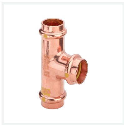
Té Profipress G avec SC-Contur modèle 2618 article 346 065