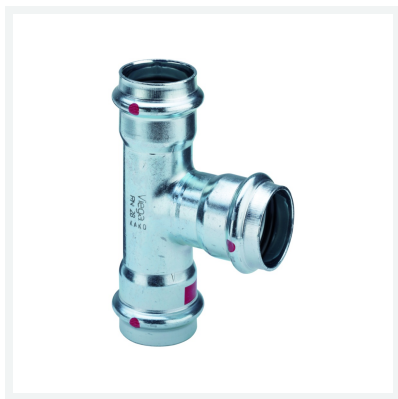
Té Prestabo avec SC-Contur modèle 1118 article 558 628