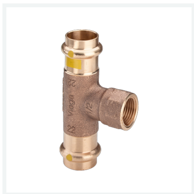
Té Profipress G modèle 2617.2 article 352 707