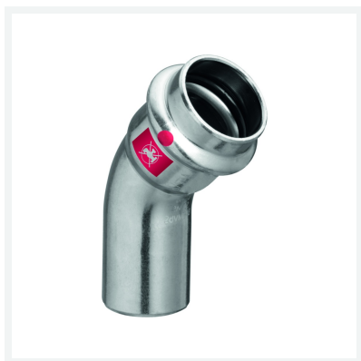
Coude 45° Prestabo modèle 1126.1 article 558 376