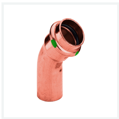
Coude 45° Profipress modèle 2426.1 article 292 522